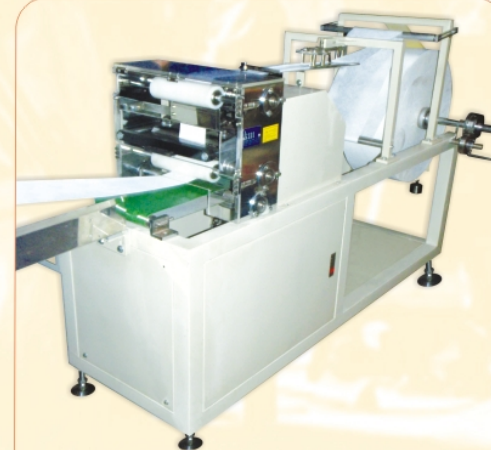
Máy xếp vải cắt