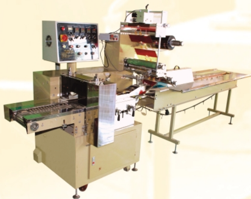
Máy đóng gói nằm (lớn)