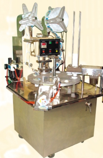
Máy dán miệng ly