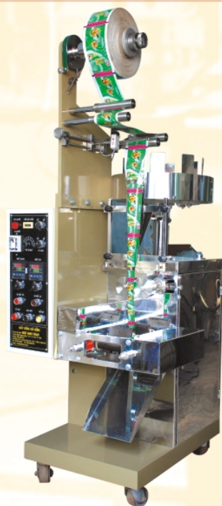
Máy đóng gói đứng (nhỏ)