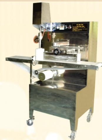
Máy định hình bánh trung thu