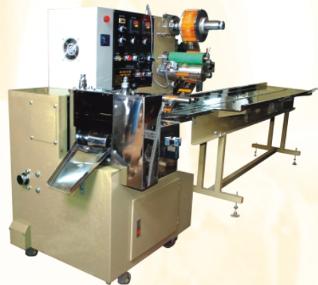
Máy đóng gói nằm (nhỏ)