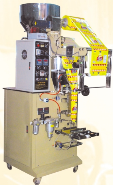
Máy đung tịnh tiến (nhỏ)