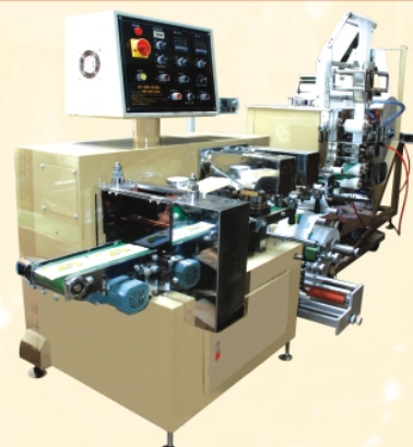
Máy đóng gói khăn lạnh